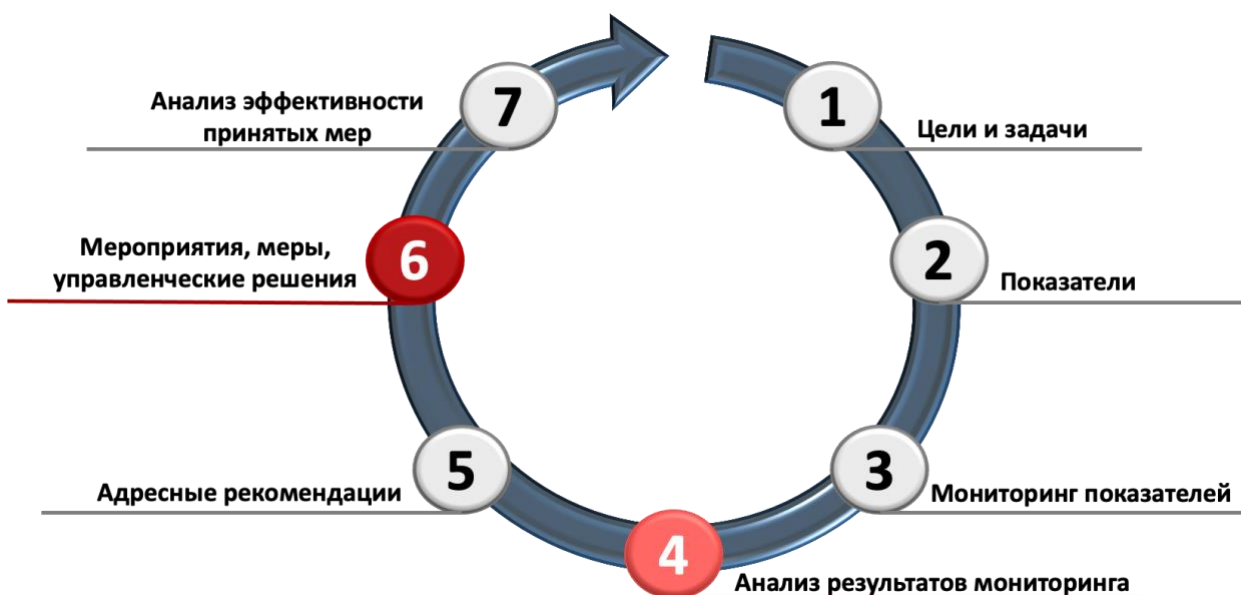
Рисунок 2 – Структура управленческого цикла. Цветом выделены элементы цикла, актуальные для всех управленческих направлений, реализуемых на уровне муниципалитета

В таблице 2 представлена детализация параметров оценивая в рамках муниципальных механизмов управления качеством образования.